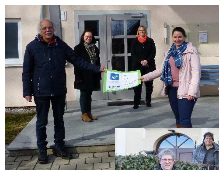
Förderbescheidübergabe Kirche auf dem Weg und Garten der Schöpfung

In den letzten Monaten wurden die Projekte Garten der Schöpfung , Kirche auf dem Weg bewilligt. Für beide Maßnahmen hat die Geschäftsstelle stellvertretend für die Bewilligungsstelle eine kleine Förderbescheidübergabe organisiert.