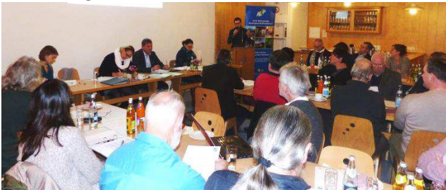
Intensive und konstruktive Diskussionen prägten die 10. Sitzung des Lenkungsausschusses in Ingenried

Und in Bernried nimmt die Wunderwelt Bernried Gestalt an: das Dorf und das Museum der Fantasie wollen mehr zusammenwachsen. Dies soll über bessere Wegeverbindungen sowie künstlerische Elemente geschehen.