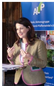
StM Kaniber zeigte sich in ihrem Grußwort begeistert von dem Vorhaben