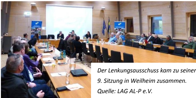
Der Lenkungsausschuss kam zu seiner 9. Sitzung in Weilheim zusammen.

Ende 2017 nahm das Gremium den Entwurf zur Fortschreibung des Aktionsplans und der Lokalen Entwicklungsstrategie entgegen, über die die Mitglieder dann im Januar 2018 im Umlaufverfahren die Empfehlung an die Mitgliederversammlung aussprachen.