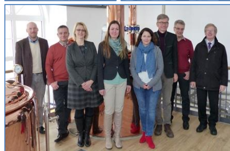
Eindrücke Jahresabschluss Hohenpeißenberg, Gruppenbild Oberland-Netzwerk